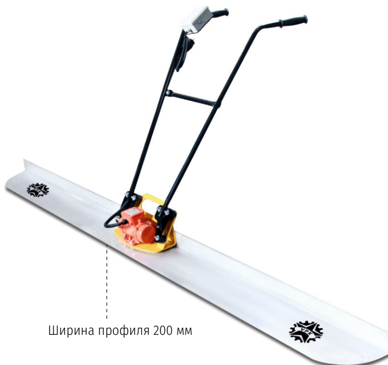
Ширина профиля 200 мм